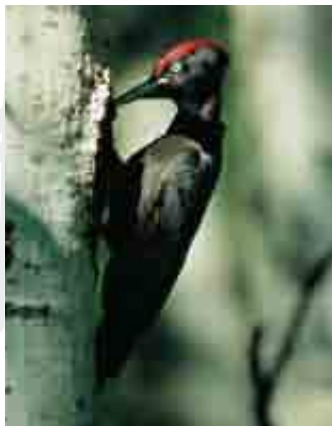
Picchio nero ( Dryocopus martius )

Talora è possibile vedere alcune bellissime farfalle diurne come Parnassius mnemosyne e Parnassius apollo , e tra i rettili, il Ramarro ( Lacerta bilineata ). Il SIC si può considerare zona di caccia per l'aquila reale e di nidificazione per i Rapaci forestali (sparviere, astore, falco pecchiaiolo) e per i Galliformi alpini, presenti con tutte e cinque le specie che si possono incontrare nel Parco delle Orobie Valtellinesi, anche se il gallo cedrone soffre della tendenza della foresta a chiudersi. Fra gli altri uccelli, la civetta nana, la civetta capogrosso e il picchio nero condividono la predilezione per gli ambienti di foresta e sono quindi ben presenti nel SIC, dove possono trovare alberi di medie e grosse dimensioni adatte alla nidificazione. Il picchio nero è il più grosso fra i picchi italiani e predilige per i propri nidi l'abete