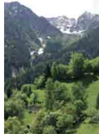
Prati e boschi

di S. Giuseppe con l'insolita cupola; infine si incunea nella valle. Lungo il percorso si può prendere la deviazione per Sostila, un antico borgo molto ben conservato con alcune case che risalgono almeno al '500, abitato in permanenza sino a pochi decenni fa e con una propria scuola sino al 1958. Da Sostila si può proseguire girando attorno al Culmine e raggiungere Campo Tartano e Somvalle, oppure ritornare verso la Val Fabiolo e risalirla nell'ultimo tratto sino a Somvalle. La discesa si può fare sia lungo la Val Fabiolo che passando per Ca rudunda , verso Forcola. Un altro itinerario che lambisce il SIC parte da Rodolo e sale, seguendo la strada (transito automobilistico consentito solo ai mezzi autorizzati), sino a Corna in Monte. Il percorso permette di apprezzare i bellissimi boschi del SIC e i maggenghi di Corna.