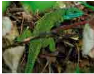
Ramarro ( Lacerta bilineata )

nana, rampichino alpestre e cincia bigia alpestre. Per favorire la presenza non solo del picchio nero ma anche del picchio verde e del picchio rosso maggiore non si devono rimuovere gli alberi vecchi e quelli morti ancora in piedi.