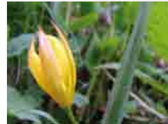
Tulipa australis

Il SIC ospita alcune specie rarissime nella flora valtellinese come Asperula purpurea , che si trova su pendici calde e assolate, Corydalis cava nei boschi di faggio, Daphne laureola nei boschi caldi al limite inferiore del SIC, l'orchidea Orchis sambucina e la bellissima Tulipa australis su prati magri e ben esposti. Il vischio ( Viscum album ) è raro e si trova sul pino silvestre nella parte ovest del SIC. Nel SIC è segnalato Laserpitium krapfii , una specie endemica che vegeta sui ghiaioni.