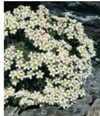
Saxifraga exarata

localizzate sulle pendici del Legnone. Sempre sulle pendici del Legnone si possono incontrare diverse sassifraghe, come per esempio Saxifraga exarata o Saxifraga bryoides . Il nome "sassifraga" deriva dal latino e significa "che rompe i sassi": molte specie di questo genere infatti vivono nelle fenditure delle rocce.