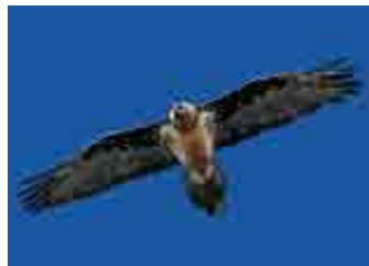
Gipeto ( Gypaetus barbatus )

Da un punto di vista faunistico l'area ospita numerose specie di mammiferi tipiche alpine: tra gli ungulati vi sono lo stambecco, reintrodotta nel 1989, il camoscio, il cervo e il capriolo. La marmotta è abbondante, mentre la lepre variabile appare in regresso. Tra gli uccelli sono presenti il gallo