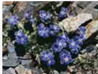
Eritrichium nanum

Le specie di piante che arricchiscono la biodiversità del sito sono numerose. Negli ambienti di rupi silicee si possono vedere fiori di grande bellezza, come l' Androsace brevis o l' Androsace vandellii , piante endemiche con areale ristretto e